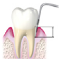
歯周ポケット検査