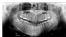
顎全体のレントゲン